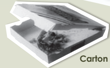
Carton de pizza