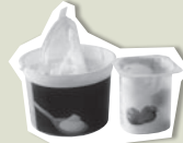
Pot de yaourt, crème fraîche