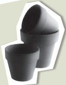
Pot de fleur