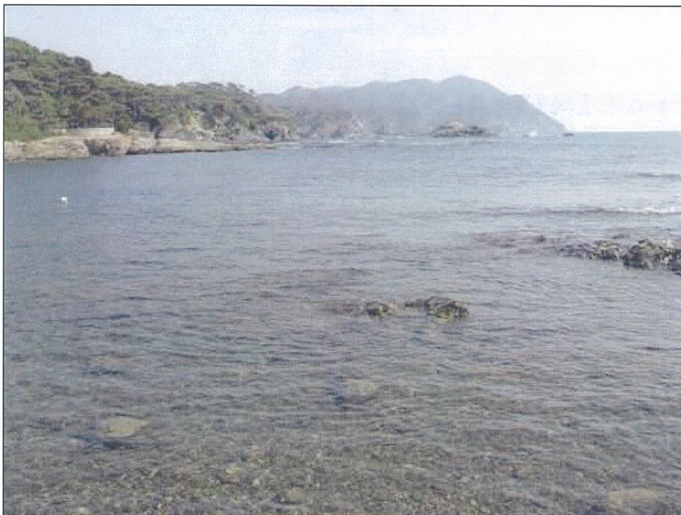
Vue sur le Cap Sicié, au sud de la commune

Photo : S. FLEURY, 01/10/2009, Six-Fours-les-Plages (83)