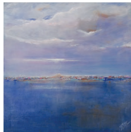
Entre ciel et mer

La matière côtoie le glacis, le couteau côtoie le pinceau. Le dessin est inexistant, les mouvements de la spatule construisent l'oeuvre au fur et à mesure en toute liberté. Quand l'erreur ou le hasard l'entraîne vers d'autres horizons. Quand le sujet surgit enfin du néant, le miracle se produit.