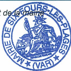
Cachet de la mairie