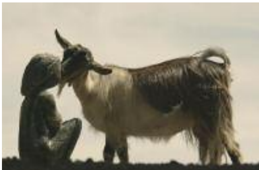
Benera+Estefan, Desfacerea Lumii, 2024

Ouverture au public : dernier week-end de résidence