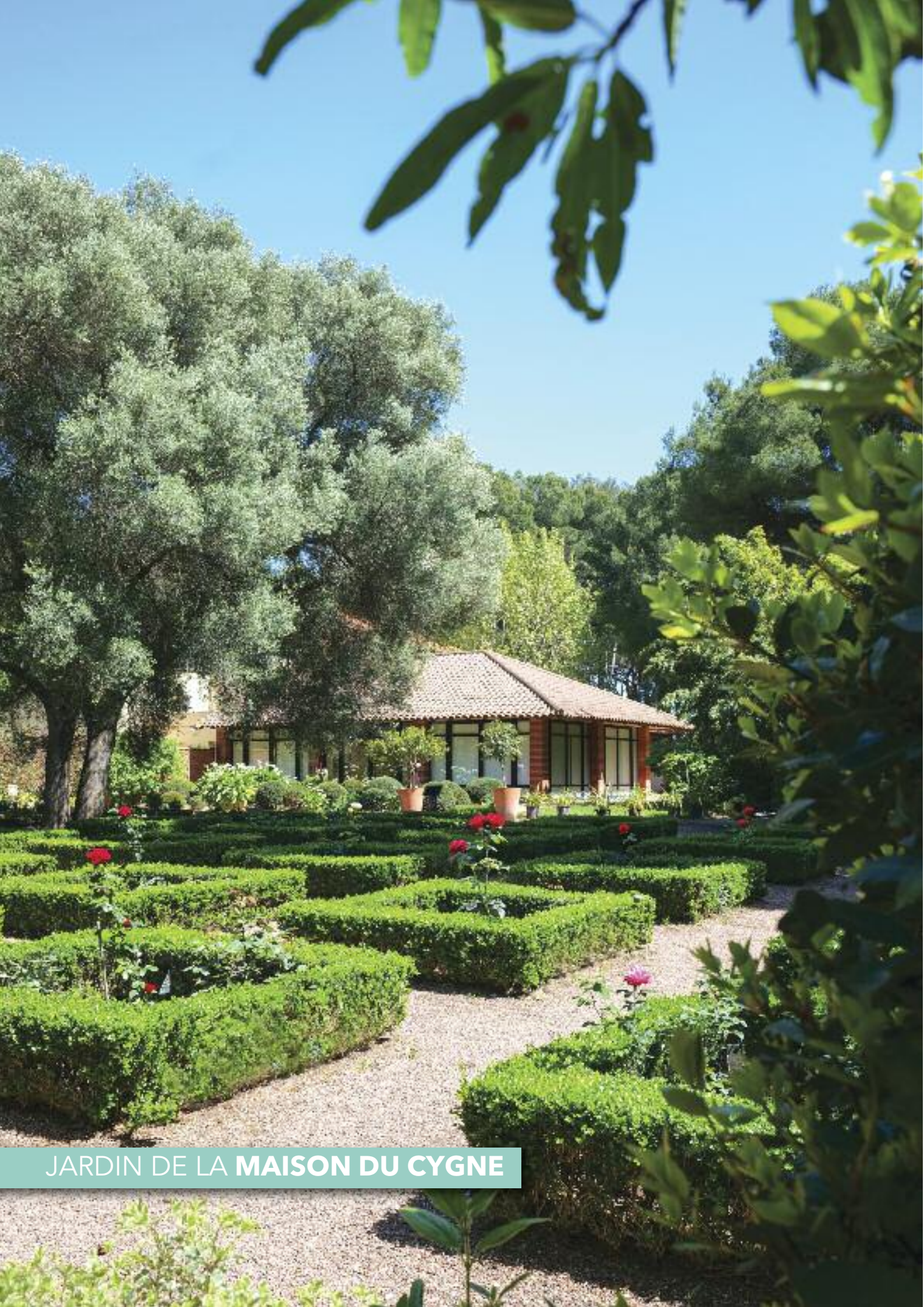
JARDIN DE LA MAISON DU CYGNE